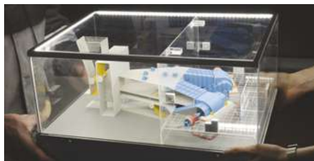
Макет системы автоматизированного управления и контроля вентилятора главного проветривания

Автоматизированные системы, создаваемые профессионалами АО «СИНТЭП», постоянно совершенствуются в целях 100-процентного выполнения требований заказчика, более удобной эксплуатации оборудования и повышения его надежности. Все оборудование и услуги предприятия имеют необходимые сертификаты соответствия. Также в начале этого года компания получила статус организации, осуществляющей деятельность в сфере информационных технологий, аккредитованной Министерством связи и массовых коммуникаций РФ, и была внесена в реестр аккредитованных ИТ-компаний. Р