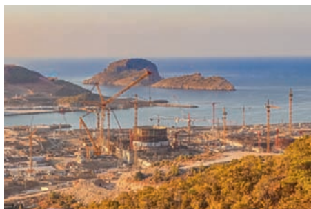
Строительство АЭС «Аккую», Турция

Работы еще не окончены, в рамках данного проекта ООО «ИнСетКом» запланировано поставить и смонтировать еще 17,7 тысячи единиц оборудования, 380 тысяч квадратных метров воздуховодов третьего и четвертого класса безопасности, а также 250 тонн труб технических трубопроводов. ▶