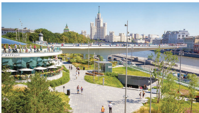
Парк «Зарядье» в Москве

Сегодня в Подмоскovie проживают свыше 8,5 миллиона человек, это второе место в России по численности населения после Москвы. А сама территория Московской области превышает площади многих стран Европы. В настоящее время административно область состоит из 52 городов областного подчинения (с их административными территориями), трех поселков городского типа областного подчинения (с их административными территориями) и пяти закрытых административно-территориальных образований.