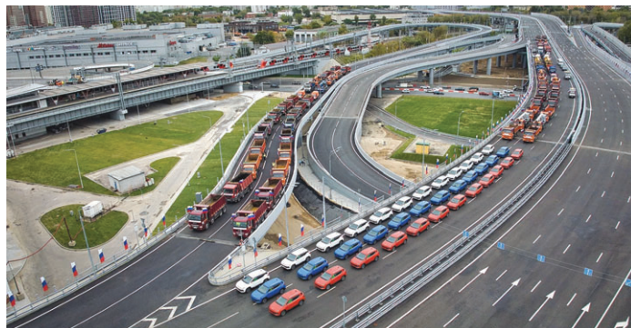
Открытие южного направления Московского скоростного диаметра. Сентябрь 2023 года

По материалам www.calend.ru , www.minter.mosreg.ru , www.riamo.ru