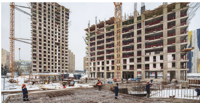
Строительство жилых комплексов в Подмоскovie

Ежегодно в регионе строится 580 многоквартирных домов, насчитывающих в совокупности 130 тысяч квартир. Кроме